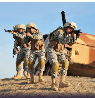
INFANTE DE AVIACIÓN